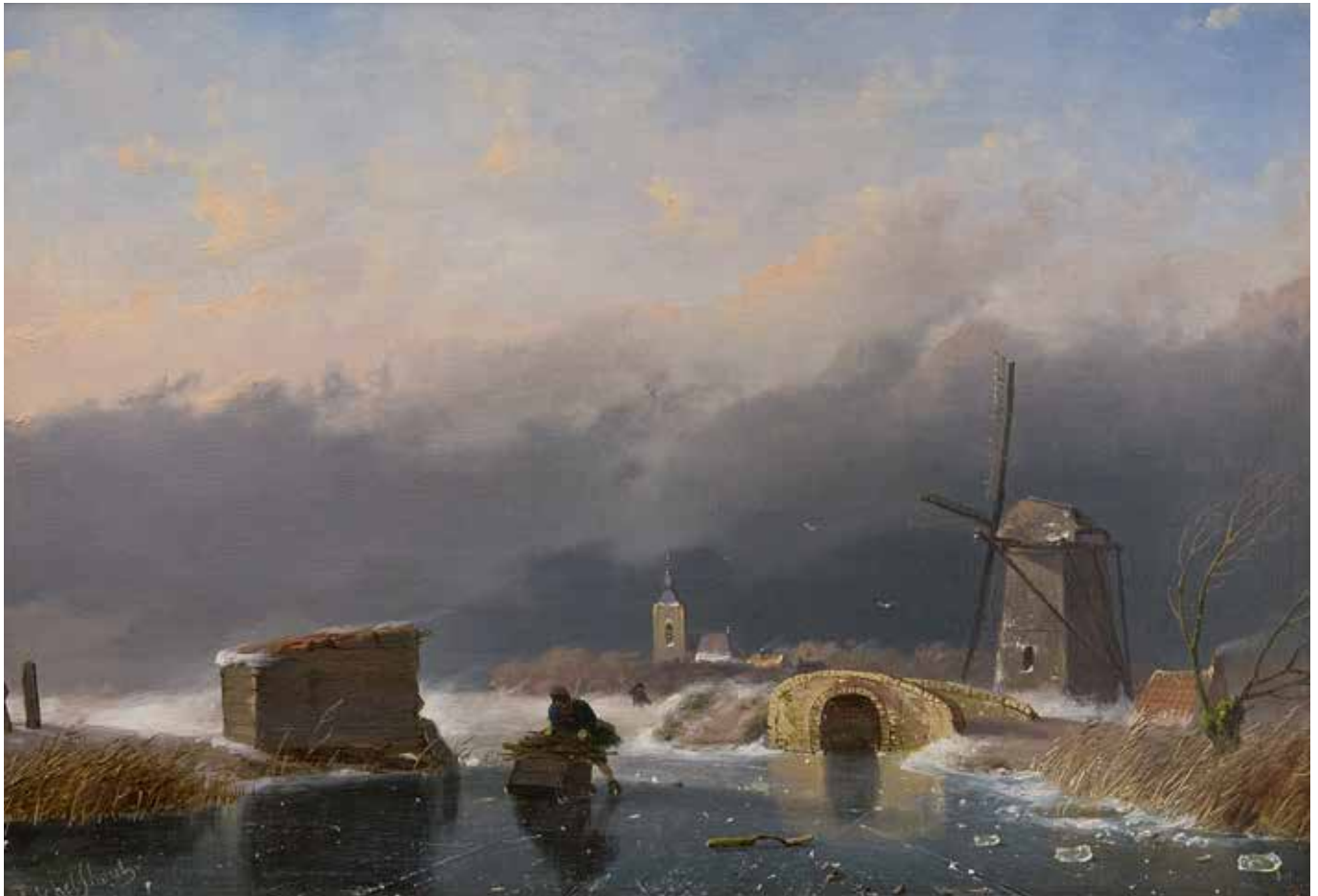
Andreas 'Andries' Schelfhout > 1787 - 1870 Ijsgezicht met houtspokkelaar bij een molen

Olie op paneel 27 x 38 cm, gesigneerd linksonder